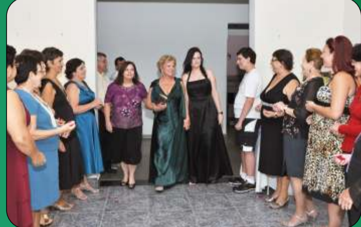
No hall de entrada do Lions Club de Amparo, recepcionada por amigos e familiares